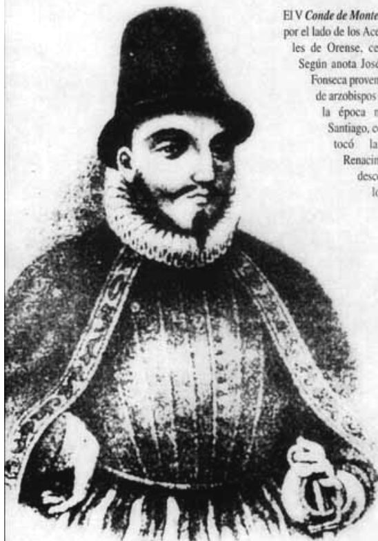
Gaspar de Zúñiga.

Monterrey. Procedía este linaje gallego de los Fernández Temes. Tuvieron su solar en tierras de Chantada donde es conocido el Pazo de los Boán en Orense 6 . Sin contar a los dos distinguidos licenciados mencionados que ocuparon de hecho la primera magistratura del Perú hubo al menos cinco virreyes gallegos, a saber: don Gaspar de Zúñiga y Acevedo y Fonseca — V Conde de Monterrey —; don Antonio García Sarmiento de Sotomayor — Conde de Salvatierra —; don Pedro Fernández de Castro — Conde de Lemos —; don José Antonio de Mendoza — Marqués de Villagarcía — y Francisco Gil de Taboada y Lemus 7 .