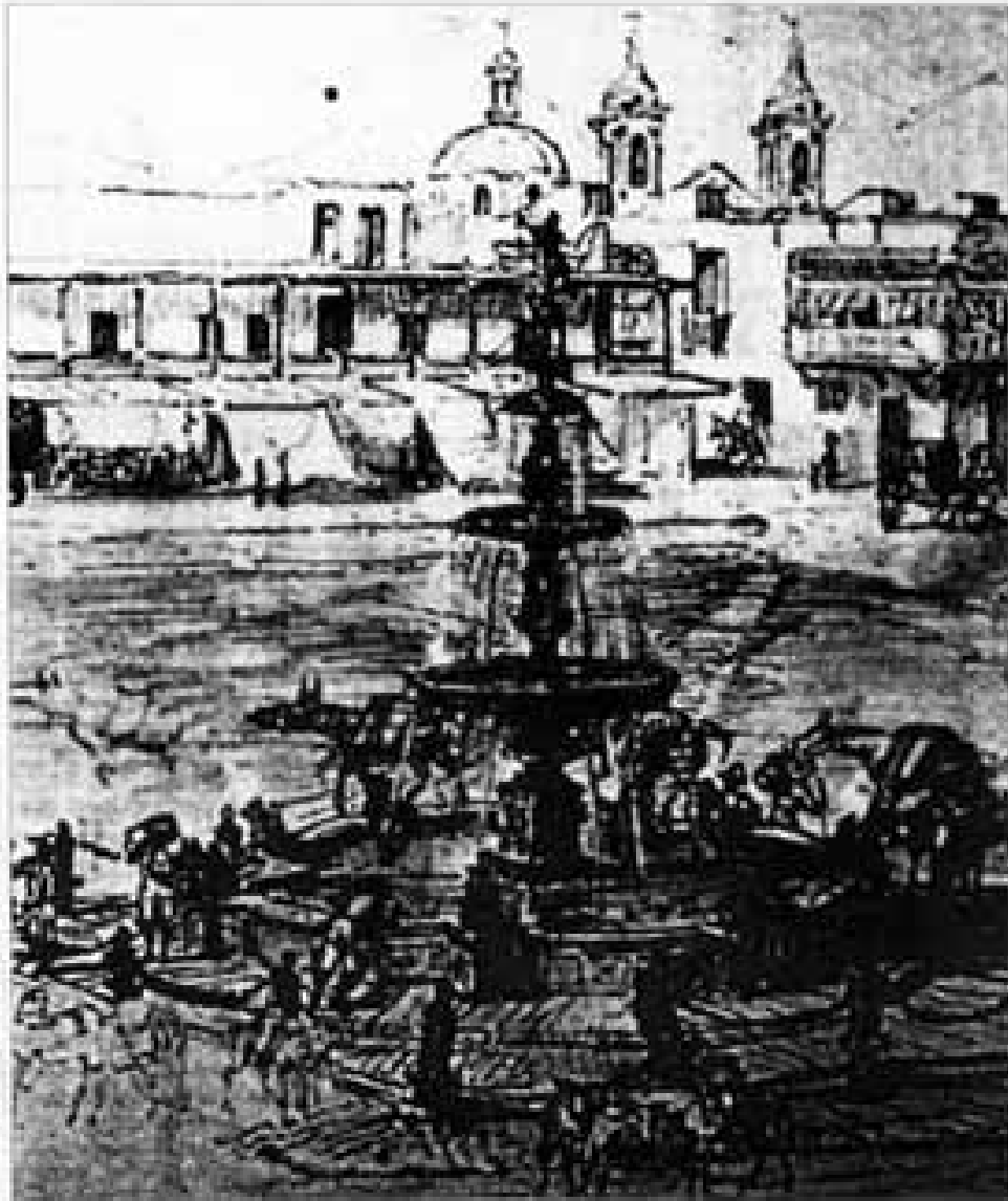
Fuente de San Pedro de la Plaza Mayor de Lima, según dibujo de Antonio Segura (Biblioteca Nacional de España)

afamados virreyes por su profunda y vistosa exteriorización de su devoción católica. Celebró con pompa la beatificación de Santa Rosa de Lima para lo cual se pavimentó la ciudad de barras de plata. Estableció la práctica de que todos se arrodillasen en las calles al anunciar la campana de la catedral que se alzaba el Santísimo en la misa mayor y la de tocar plegarias a las nueve de la noche por los