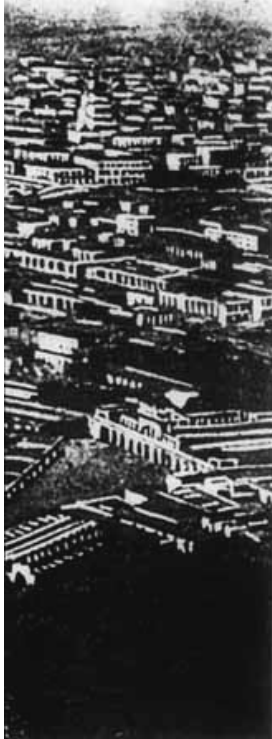
Vista panorámica de la ciudad de Lima.

García de Castro era natural de Villanueva de Valdeuzza, en el obispado