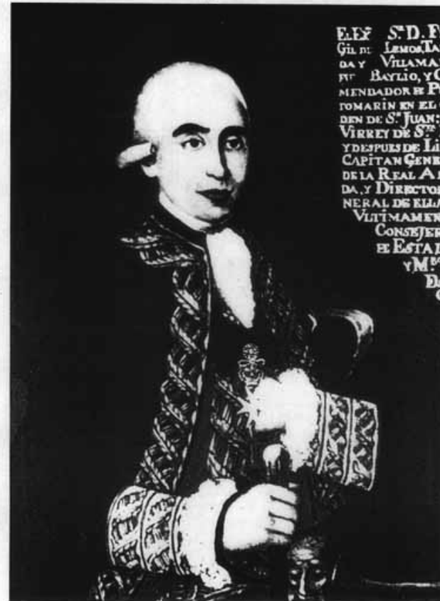
Francisco Gil de Taboada y Lemus.

Francisco Gil de Taboada y Lemus (1790-1796) había nacido en 1736 en Santa María de Soto Longo, en el ayuntamiento de Lalín, provincia de Pontevedra, obispado de Lugo. En esta