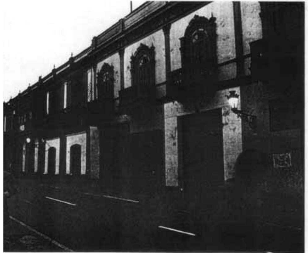
Edificios coloniales en una calle del centro de Lima.