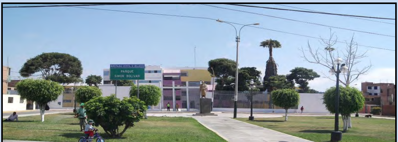
Tercera ubicación de la estatua de Bolívar en la Urb. Ciudad del Pescador, Callao.

En esta tercera y triste ubicación del monumento, lejos del ajetreo de la gente y de los vehículos y del cariño y reconocimiento del pueblo en general, resalta la carencia de placa alguna. El modesto pedestal donde se yergue Bolívar se encuentra desnudo. No aparece ni la placa de la Embajada de Venezuela, ni la inicial del Alcalde del Callao. No hay ninguna referencia. Está sola y abandonada como el Libertador en sus últimos días de agonía.