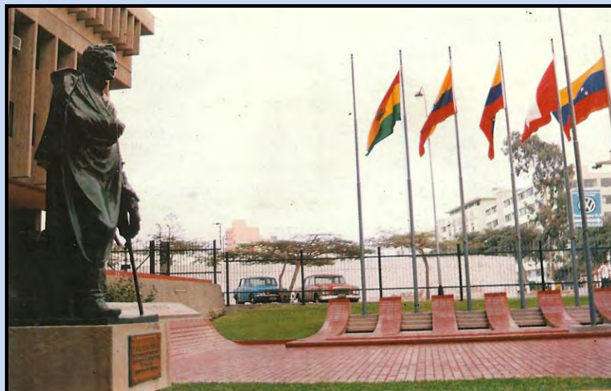
Primera ubicación de la Estatua de Bolívar

La inicial ubicación del bronce, como quedó expresado, estaba en San Isidro. El Libertador se representaba de pie sosteniendo con su mano izquierda sobre su pecho un enrollado de papel a la manera romana antigua y asiendo en su mano derecha una sencilla espada que mira al suelo como una suerte de bastón. El monumento descansaba sobre un pequeño pedestal de piedra donde se apreciaba la infaltable placa. Veamos la foto de este primer lugar de la estatua de Bolívar.