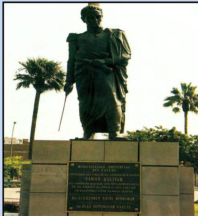
Monumento a Bolívar en Bellavista con placa original del alcalde del Callao.

Años después, comenzando el s. XXI se advierte que la placa recordatoria mencionada se había esfumado, posiblemente por acción dolosa de los amigos de lo ajeno. El 17 de diciembre de 2004, día del aniversario de la muerte de Bolívar, la Embajada de la República Bolivariana de Venezuela coloca allí una nueva placa en recuerdo del 174° aniversario de su desaparición física. Veamos esta segunda placa.